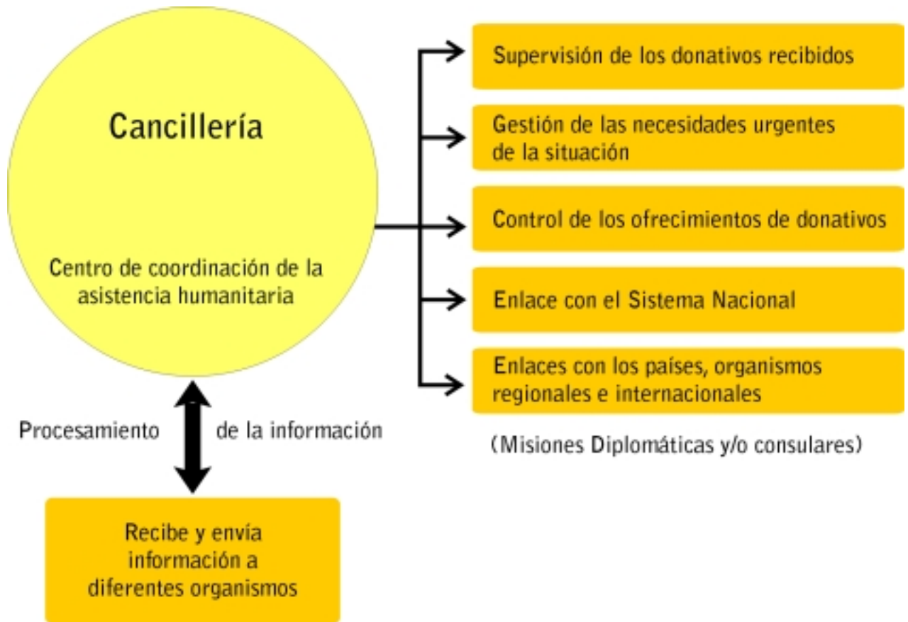
Figura B. Gestión de la Cooperación Internacional