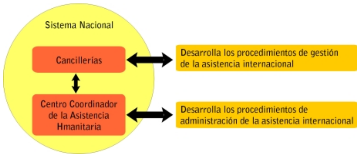
Figura A. La Cancillería como parte del CCAH

El CCAH estará coordinado por el organismo rector del sistema nacional de cada país.